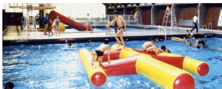
/// Le bassin intérieur dans les années 90.

En 2005, le stade nautique Fernand Belino, ne correspondant plus aux normes, est détruit pour laisser place à des logements. Le Canyon, équipement multisports nouvelle génération plus proche du centre-ville, prend désormais le relais.