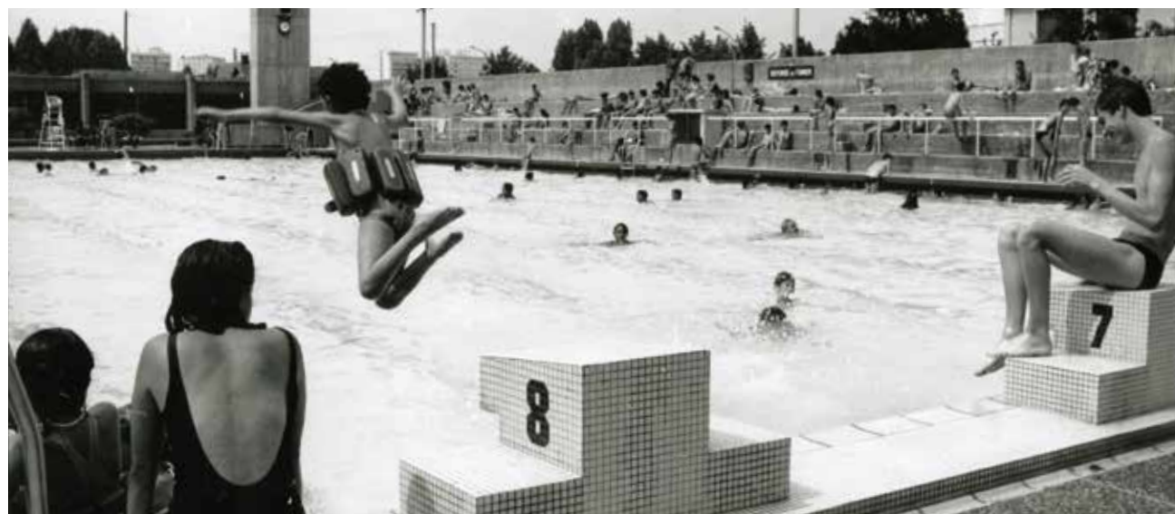
/// Le bassin extérieur dans les années 70.

Construit en 1971, le stade nautique Fernand Belino, en activité jusqu'en 2005, est emblématique d'une époque marquée par une effervescence architecturale et artistique et qui promeut l'activité physique en plein air, propice à l'épanouissement des jeunes.