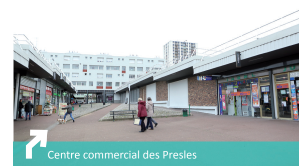
Centre commercial des Presles

En complément, un salon de coiffure et un salon d'esthétique sont situés en face, le long de l'avenue de la Marne.