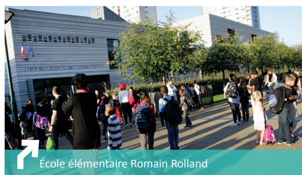
École élémentaire Romain Rolland

L'OGIF, propriétaire du centre commercial, s'intègre à cette dynamique de rénovation dans le cadre d'un projet de requalification du mail commercial prévoyant un remodelage des façades et une rénovation des espaces extérieurs.