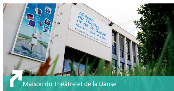
Maison du Théâtre et de la Danse