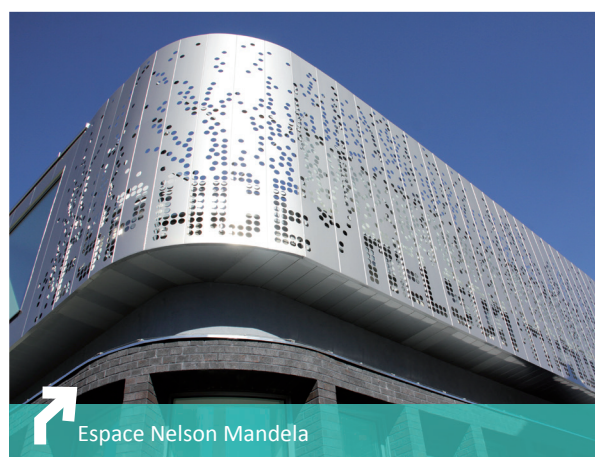
Espace Nelson Mandela