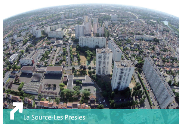
La Source-Les Presles

Rénovation des espaces et des équipements publics, réhabilitation et résidentialisation de logements, ce sont plus de 30 millions d'euros qui sont investis dans le quartier. Parmi les opérations réalisées ces dernières années, on peut noter la construction de l'Espace Nelson Mandela (un centre socioculturel et une crèche en multiaccueil), les restructurations du groupe scolaire et du gymnase Romain Rolland.