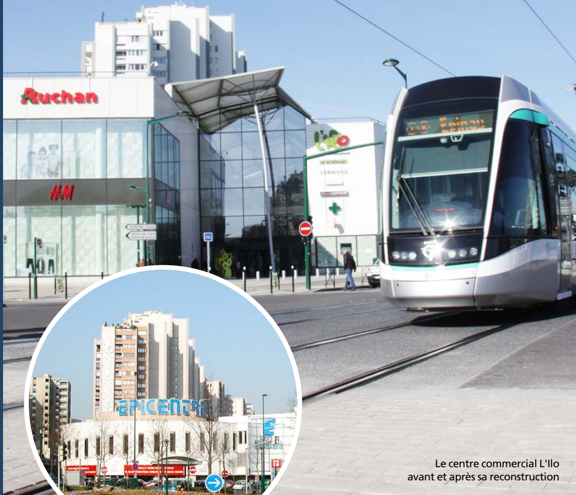
Le centre commercial L'Ilo avant et après sa reconstruction