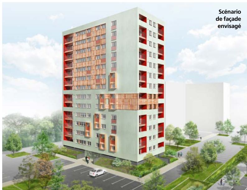
Scénario de façade envisagé

Par ailleurs, avenue de Jarrow, place Munch, rues Ravel, Chabrier, Couperin et Berlioz, une opération de résidentialisation est programmée. 482 logements, répartis en six bâtiments formant trois îlots, sont concernés. Des espaces verts et des aires de convivialité vont être créés, tandis que la voirie existante et le stationnement seront requalifiés. En parallèle, les logements feront l'objet