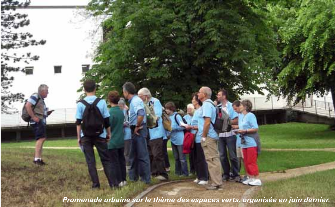
Promenade urbaine sur le thème des espaces verts, organisée en juin dernier.