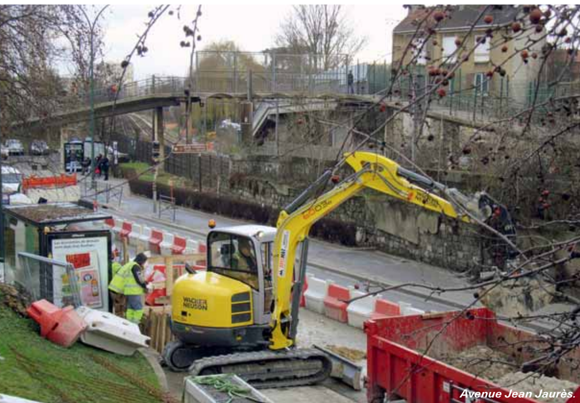
Avenue Jean Jaurès.

Chaque mois, nous vous informons des différents chantiers qui s'effectuent dans la ville. Travaux de rénovation des routes, embellissement, entretien, toutes ces améliorations du cadre de vie modifient parfois le quotidien. Cette page est destinée à vous prévenir de ces transformations initiées pour le mieux-vivre des Spinassiens.