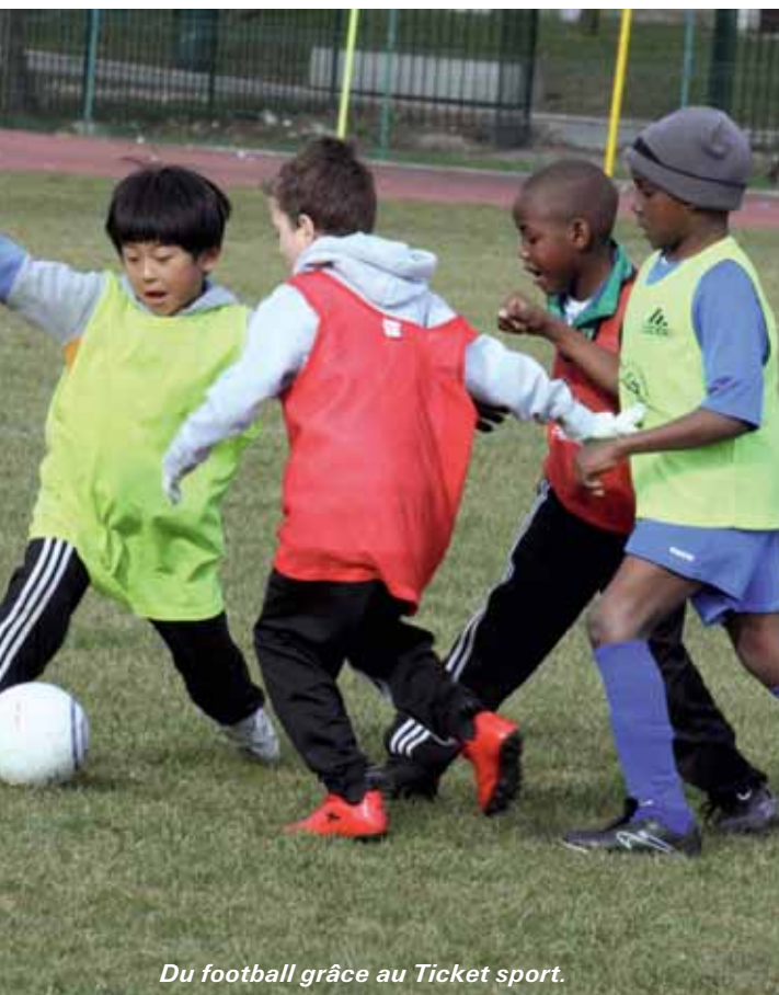
Du football grâce au Ticket sport.