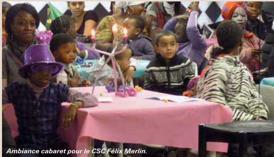
Ambiance cabaret pour le CSC Félix Merlin.