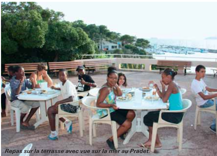
Repas sur la terrasse avec vue sur la mer au Pradet.

La Ville met aussi en place chaque année un voyage à l'étranger pour les plus de 60 ans. Les centres de vacances de Pleubian et du Pradet accueillent les seniors en juin et en septembre. En collaboration avec la Ville, l'Agence Nationale pour les Chèques-Vacances (ANCV) propose, en plus, 170 destinations en France. Des catalogues sont disponibles au CCAS.