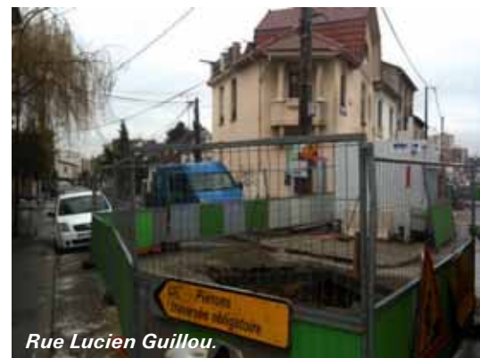
Rue Lucien Guillou.