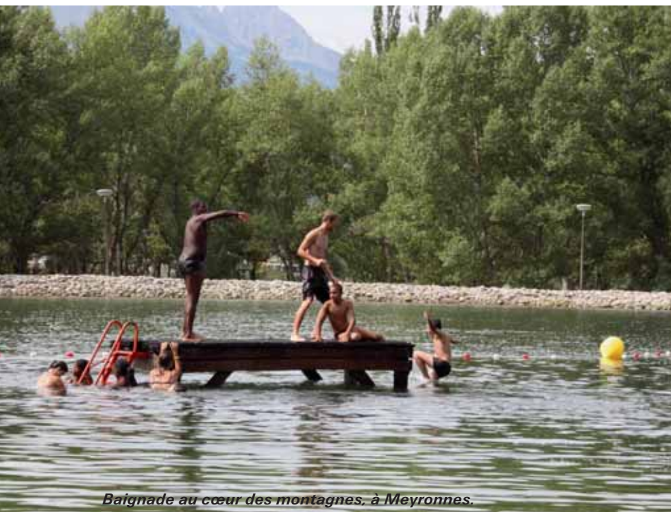
Baignade au cœur des montagnes, à Meyronnes.