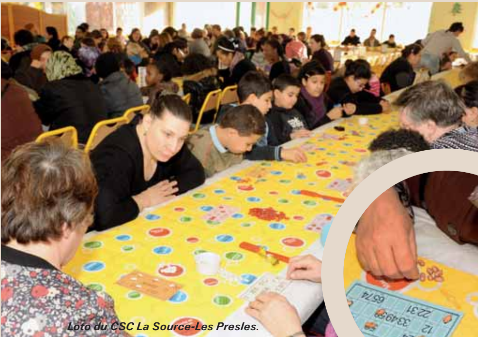
Loto du CSC La Source-Les Presles.

Les festivités organisées à l'occasion du partage de la traditionnelle galette des Rois ont rencontré un franc succès puisque près de 60 Spinassiens y ont participé les 8 et 15 janvier derniers. La preuve en images!