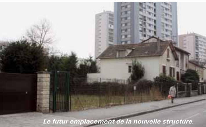
Le futur emplacement de la nouvelle structure.

E n 2013, un nouvel équipement ouvrira ses portes au 66, avenue de la Marne. D'environ 1 300 m 2 , il abritera le centre socio-culturel du quartier et une nouvelle crèche. Le premier permettra aux