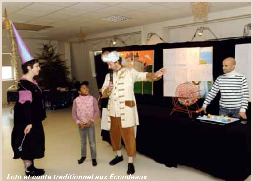
Loto et conte traditionnel aux Écondeaux.