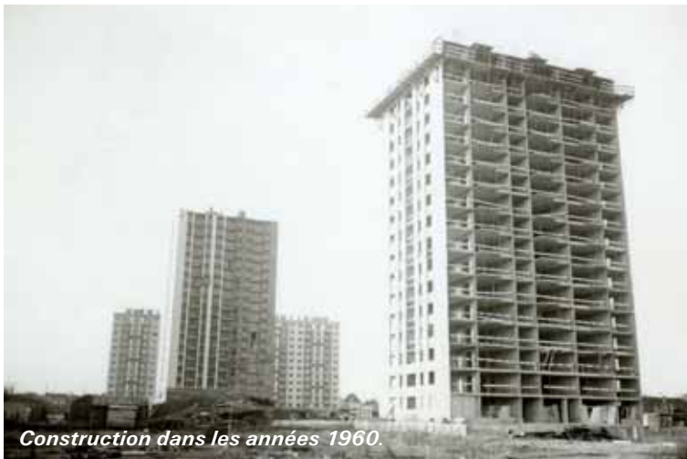
Construction dans les années 1960.

Urbanisé à la fin des années 1960, ce quartier recoupe à peu près l'ancien lieu-dit des Presles et une partie de l'emplacement de l'étang Coquenard.