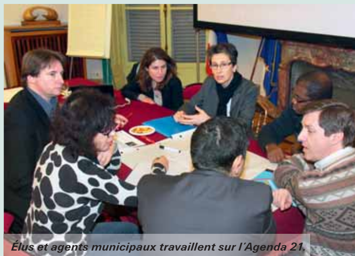
Élus et agents municipaux travaillent sur l'Agenda 21.