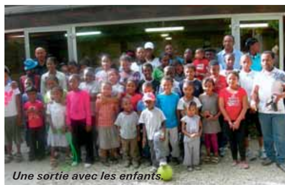
Une sortie avec les enfants.