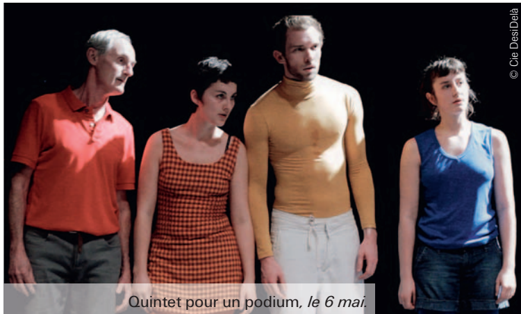
Quintet pour un podium, le 6 mai.