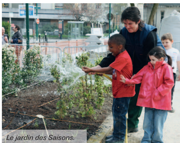
Le jardin des Saisons.