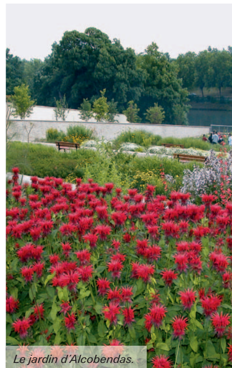
Le jardin d'Alcobendas.

Rénover tous les parcs et squares d'ici 2014 est un des objectifs de Plaine Commune. Zoom sur les travaux qui viennent d'être réalisés et sur ceux qui sont programmés dans les prochains mois.