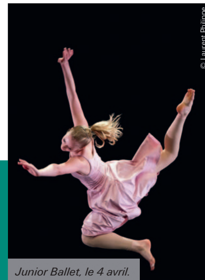
Junior Ballet, le 4 avril.