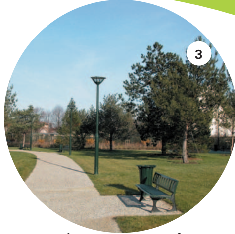
Le jardin des Presles