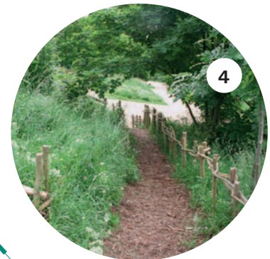
Le parc Lihou