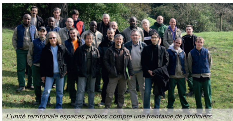
L'unité territoriale espaces publics compte une trentaine de jardiniers.

À Épinay-sur-Seine, notre objectif est de rénover l'en-