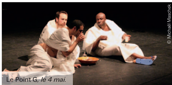
Le Point G, le 4 mai.