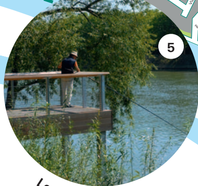
Les berges de Seine