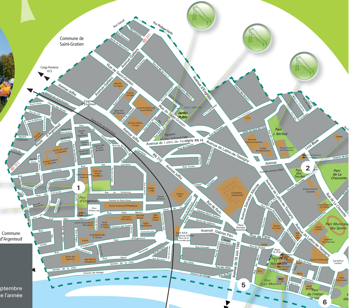
Le parc d'Orgemont