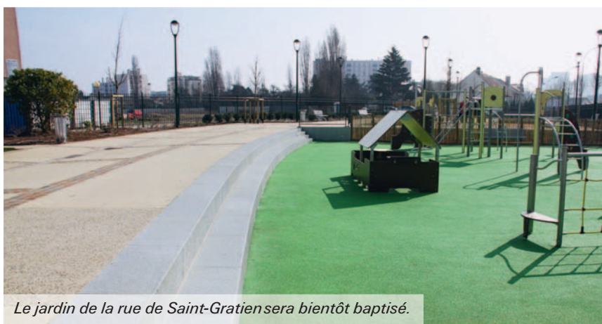
Le jardin de la rue de Saint-Gratien sera bientôt baptisé.