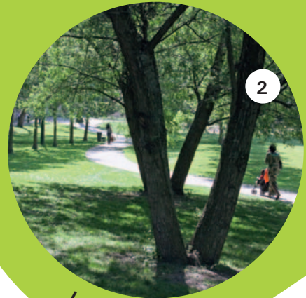
Le parc des Saules