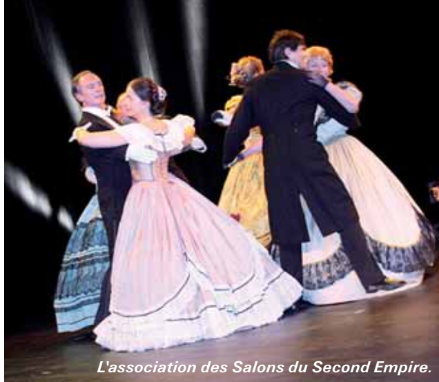
L'association des Salons du Second Empire.