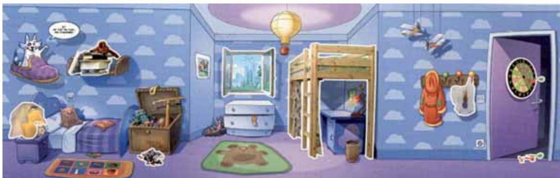
Exposition « Prudent contre les accidents » du 17 au 23 février à l'Hôtel de Ville.