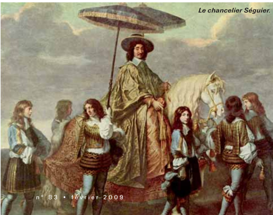
Le chancelier Séguier.