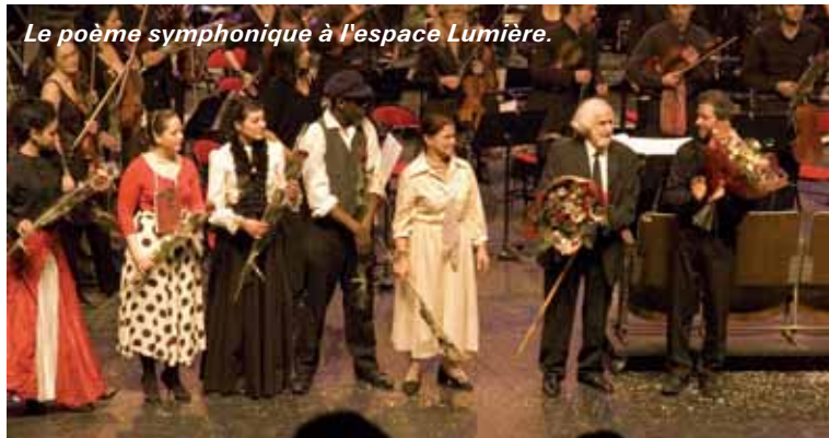
Le poème symphonique à l'espace Lumière.