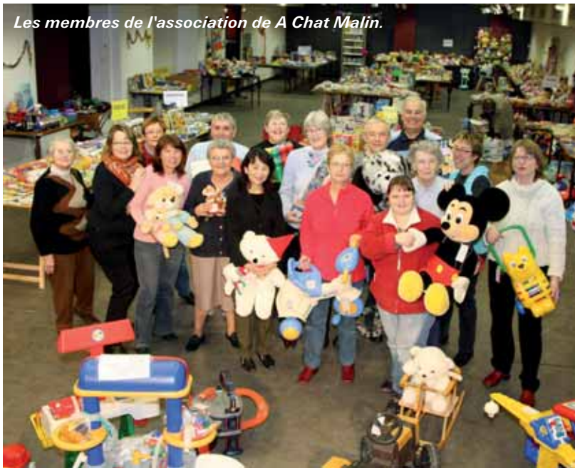
Les membres de l'association de A Chat Malin.