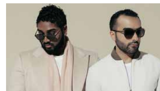
DJ Maan on the moon