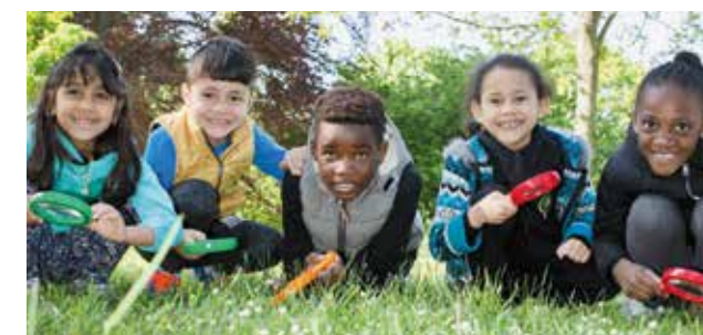
→ Exposition du Projet Nature du 13 juin au 5 juillet dans le hall de l'Hôtel de Ville - Visite libre aux heures d'ouverture