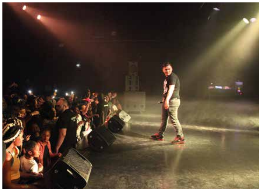
→ Samedi 15 juin à partir de 20h au Pôle Musical d'Orgemont (1, rue de la Tête Saint-Médard) - Gratuit - Plus d'infos au 01 48 41 41 40