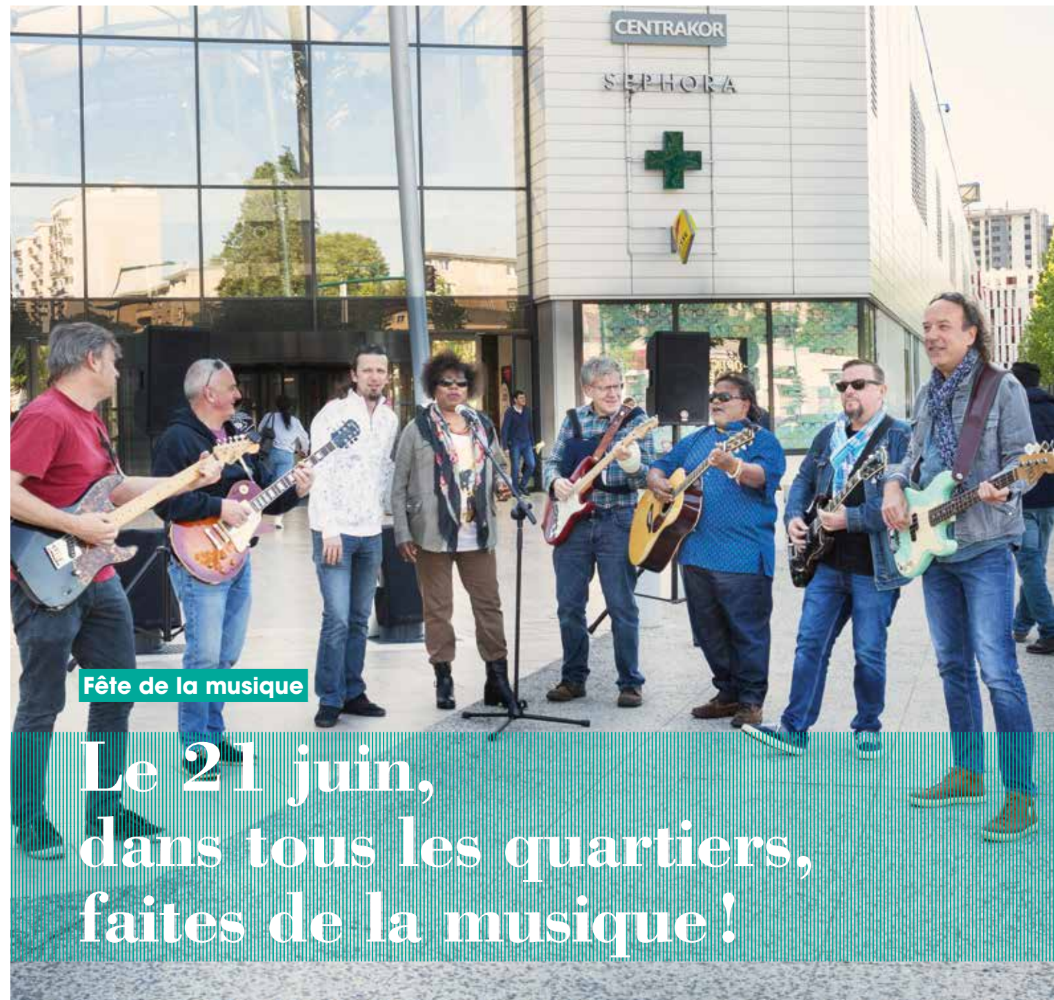
Fête de la musique

Le 21 juin, dans tous les quartiers, faites de la musique !