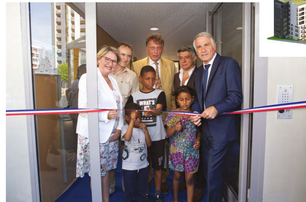
Inauguration de la résidence Signature le 24 juin 2019.