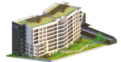
Illustration du futur programme immobilier de l'AFL.