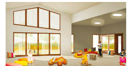
Perspective de la salle d'activité de la section « Moyens ».

Par ailleurs, un patio intérieur, permettant de distribuer la lumière au centre de la structure, accueillera la cour des bébés. Ceux-ci seront ainsi isolés de l'agitation des autres enfants qui eux bénéficieront d'une cour côté jardin. Enfin, les espaces dédiés au personnel et les espaces techniques seront eux aussi rénovés, et des travaux de mise aux normes handicapés et incendie seront réalisés.