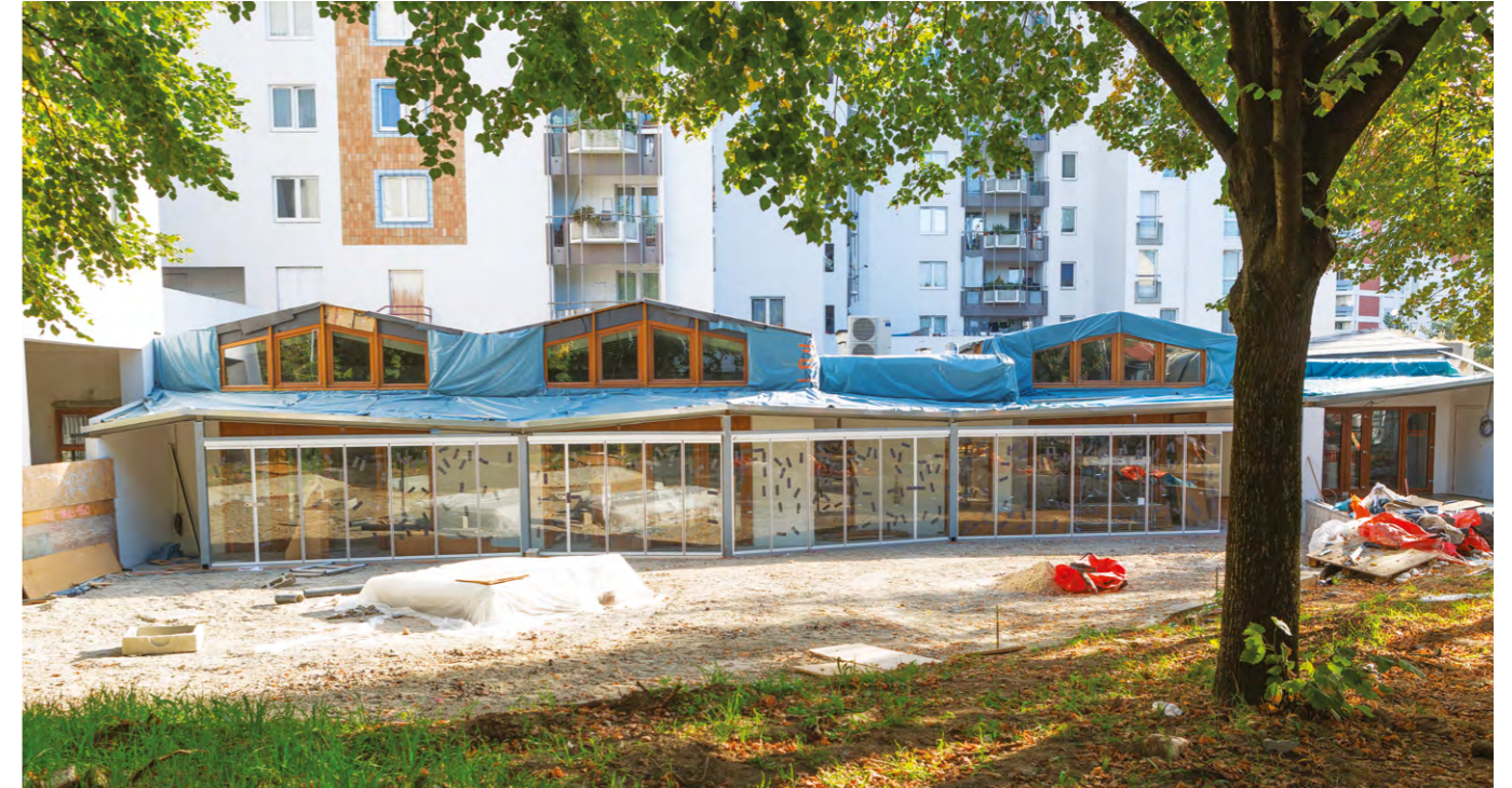
Nouvelle entrée de la crèche située rue de l'Église.

Dans le Centre-ville, la tour 4K, située rue Dumas, est en cours de démolition. Son chantier a pris du retard et il devrait reprendre d'ici la fin de l'année et durer environ 18 mois.