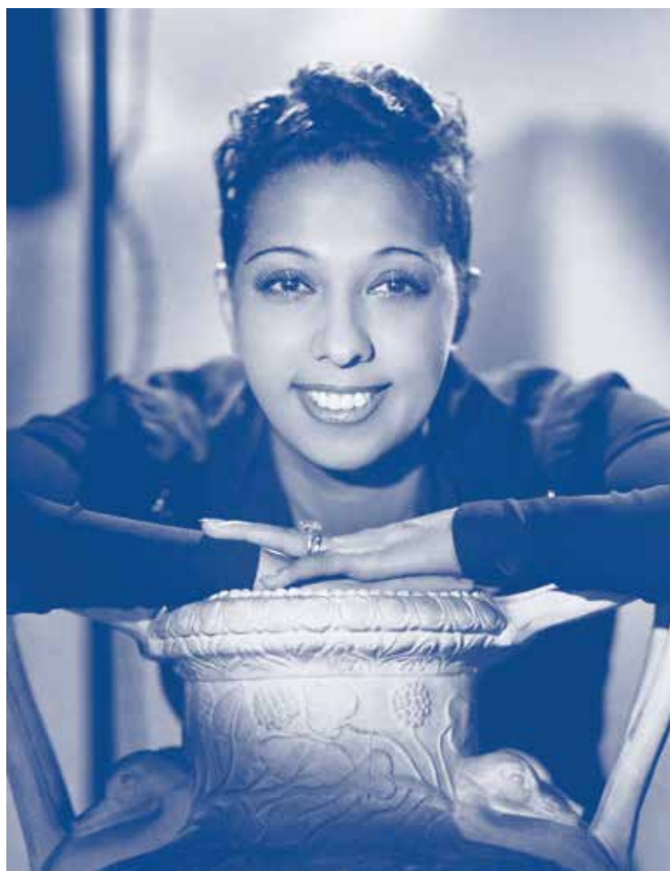
Joséphine Baker, en 1940

Résistante, artiste, militante... C'est à Joséphine Baker, cet immense personnage de l'histoire de France, que la Ville a choisi de rendre hommage en donnant à l'actuel centre socioculturel des Écondeaux le nom d'Espace Joséphine Baker. Cet Espace abritera la halte-jeux Tom Pouce.