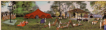
Ce nouveau lieu culturel doit ouvrir partiellement au public dès le mois de juin.

Le lieu, situé en p est vaste: 2,5 he et un bâtiment de 8 boisé. "Nous inst